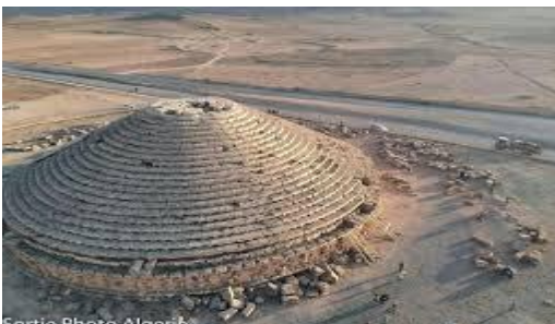
Sortie Photo Algerie